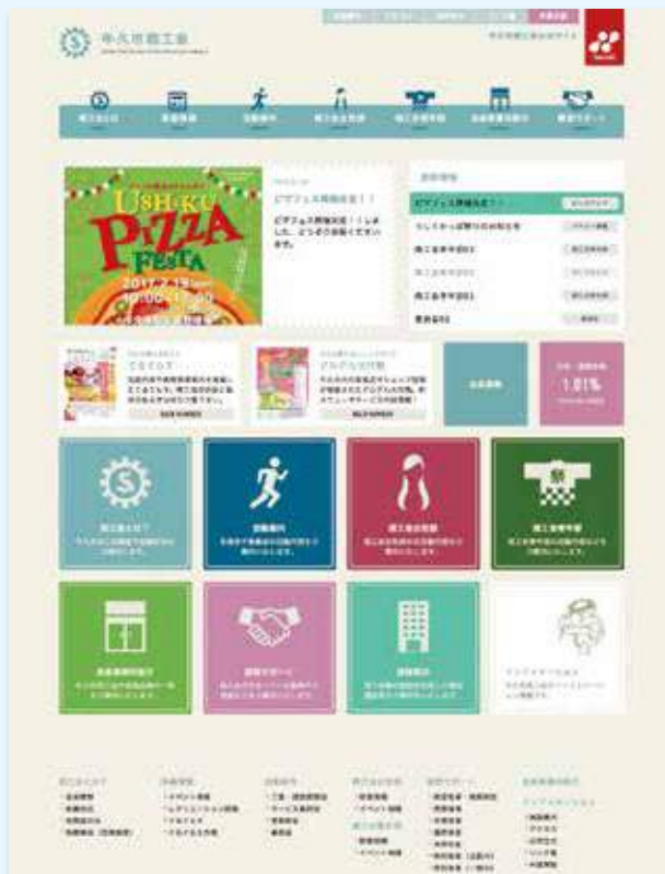
※トップページイメージ