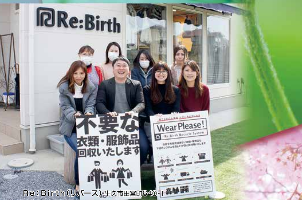
Re:Birth(リバース) 牛久市田宮町640-1