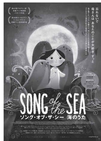
©Cartoon Saloon, Melusine Productions, The Big Farm, Superprod, Nerlum

《出店者》芋千/森永牛乳(有)つばた/DIPIKA/ミートデリカなかじま/阪田ストア/牛久市商工会青年部