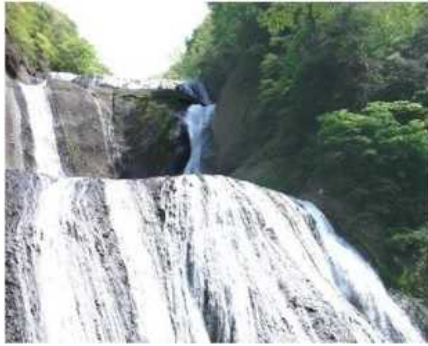
大子町・袋田の滝